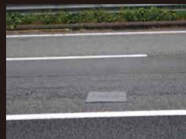
高速道路での適用例

PMR99+は、強さと柔軟性を兼ね備えた超高粘度アスファルトマット型舗装補修材です。損傷の初期段階（小面積のひび割れなど）で路面に貼り付け補修を行います。舗装の延命化を図り、ライフサイクルコストを低減させ、予防保全的維持に最適な材料です。