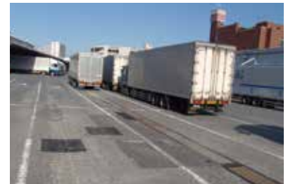
埼玉県内 物流センター