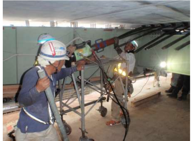
スパン中央部での PC 鋼材挿入および緊張状況