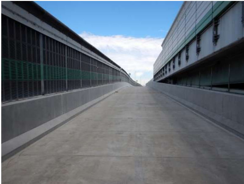
UFC道路橋床版を用いてリニューアルした阪神高速15号堺線 玉出入路

水結合材比が15%程度、圧縮強度が150N/mm 2 以上で極めて緻密な鋼繊維補強コンクリート