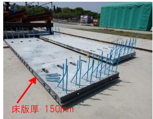
工場で製作された平板型 UFC 床版