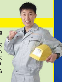
※イラスト・写真はイメージです

土木の現場監督を経て芸の道を志した「土木芸人」! 土木で培った体力と根性を武器に、その名の通り元気いっぱい務めます!!「土木漫談」!!「土木あるある」!!「土木エピソード」!! 土木経験を生かした人情味あふれるネタは、必見です!!