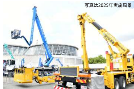
写真は2025年実施風景