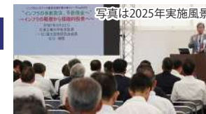
写真は2025年実施風景